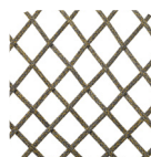
Flat Trendy rope Cocoa mix

resistente ai raggi UV, polyester IMO tested