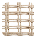
Oval Trendylope Walnut mix

resistente ai raggi UV, polyester IMO tested