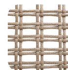
Oval Trendylope Caramel mix