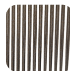
Round Trendyrope Ebony