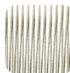
Round Trendyrope Ivory

resistente ai raggi UV, polyester IMO tested