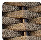
Nautic Rope Sand