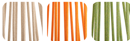
Oval Trendylope Walnut mix

resistente ai raggi UV, polyester IMO tested