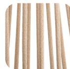
Oval Trendylope Walnut mix

resistente ai raggi UV, polyester IMO tested