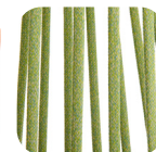
Oval Trendylope Mint mix