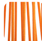
Oval Trendylope Orange mix